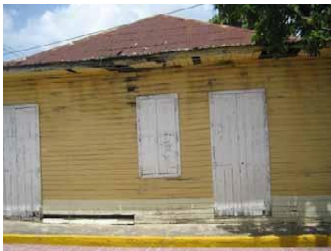
Lugar donde fue asesinado Ulises Heureaux, en Moca, 1899.

El Estado dominicano bajo la dictadura de Ulises Heureaux se considera que fue un estado oligárquico dependiente porque estuvo controlado por tres sectores: los grandes comerciantes importadores–exportadores; las compañías azucareras y los intereses estadounidenses. Heureaux basó su control político en la represión de sus opositores mediante un ejército fuerte, una red de espionaje y en una política de ganarse los opositores mediante prebendas políticas como sueldos y puestos en el gobierno. Este tipo de Estado necesitaba muchos recursos para poder enfrentar los gastos que tenía. En ese momento, las entradas del Estado dependían de los impuestos aduanales. Pero estas estaban siendo controladas primero por la Casa Westendorp y luego por la San Domingo Improvement Company para cobrar las deudas del Estado dominicano debido a los empréstitos. Esto ocasionaba que el gobierno tuviera que pedir prestado a los comerciantes, y a cambio de esto los comerciantes controlaban aduanas, cobrándose lo prestado.