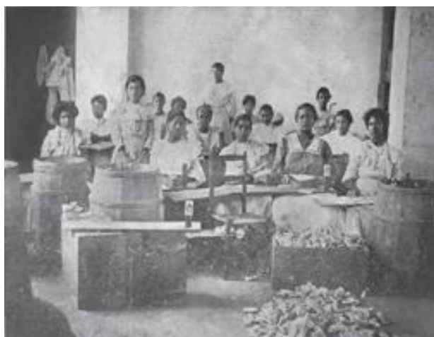
Mujeres trabajando en una fábrica de tabaco.

Los nuevos sectores de exportación que se desarrollaron a partir de la década de 1870 en la República Dominicana se basaron en relaciones capitalistas de producción. Esto es que las personas que trabajaban eran obreros que recibían un salario por su trabajo. No eran como lo productores de tabaco, quienes eran campesinos que vivían de su propia cosecha o cortadores de madera que trabajaban para el dueño de los cortes mediante contratos en que no siempre recibían un salario sino préstamos o mercancías que necesitaban.