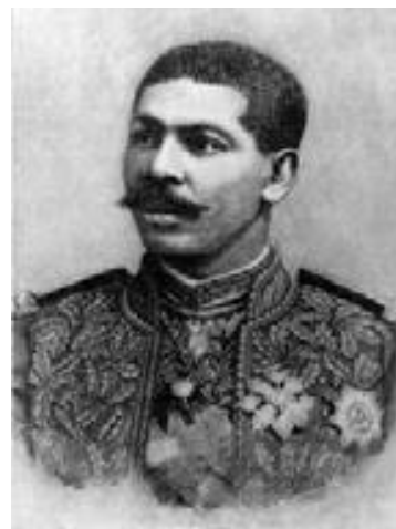
Ulises Heureaux (1845-1899).

Dentro de los gobiernos azules se encuentra el de Ulises Heureaux entre 1882 y 1884. Luego de los gobiernos de Francisco Gregorio Billini y de Alejandro Woss y Gil, Heureaux subió de nuevo a la presidencia iniciando el período que se conoce como la Dictadura de Ulises Heureaux que duró desde 1887 hasta 1899. Durante este período se reprimieron las libertades políticas y se desarrolló una política económica en beneficio de las compañías estadounidenses que lograron desplazar del mercado dominicano a las europeas.