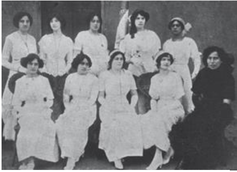
Fotografía maestras normalistas.

La reforma educativa propuesta por Eugenio María de Hostos permitió un avance en la educación. Se implementó una nueva visión educativa que contribuyó a la creación de un grupo de intelectuales que propugnaron por cambios en diferentes aspectos de la vida dominicana. Uno de esos aspectos fue la educación de la mujer y su papel en la sociedad. Hasta ese momento las mujeres no tenían posibilidad de recibir una educación profesional. Con la creación de la Escuela Normal para Señoritas