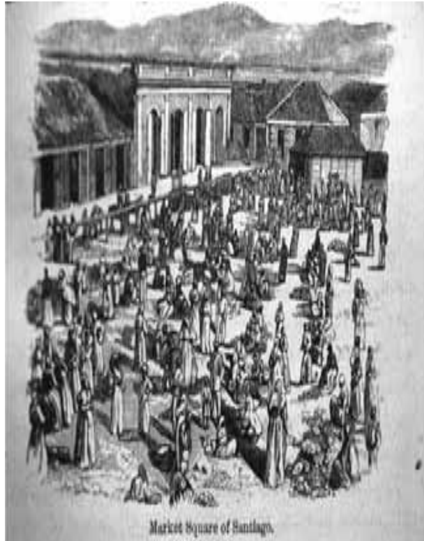
Mercado de Santiago, 1871. Libro de Samuel Hazard.

“Los pueblos (del Cibao) desempeñaron un papel esencial como puntos de enlace en el movimiento de mercancías y servicios que entraban y salían de las zonas rurales. Con la expansión de la agricultura comercial, a fines del siglo XIX y comienzos del XX, proliferaron diminutas aldeas, situadas por lo general a lo largo de las principales vías de comunicación. Algunas de estas aldeas se convirtieron en centros urbanos importantes y servían de puntos de acopio para los productos de sus alrededores. Esto supuso una concentración de riquezas en los pueblos que pudieron beneficiarse de dichas actividades económicas. Aunque hubo una gran cantidad de pequeños y medianos poblados que lograron beneficiarse económicamente gracias a su relación con el campo, fueron las ciudades más grandes –como Santiago y Puerto Plata– las que resultaron más agraciadas debido a estos intercambios. El Cibao era una especie de sistema solar, en el cual Santiago ocupaba la posición central. Los pueblos y las ciudades menores como planetas y satélites que gravitaban en torno a este centro metropolitano. Los productos de importación y el dinero en efectivo procedentes de las firmas comerciales establecidas en Santiago, pequeños. En dirección opuesta, los productos agrícolas fluían hacia Santiago, donde se preparaban para ser exportados.