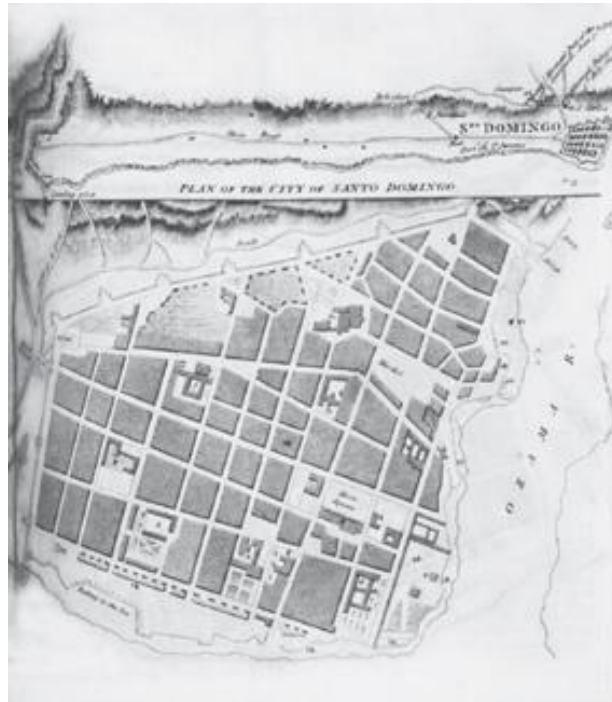
Plano de la ciudad de Santo Domingo, 1810 por William Walton.

Durante el sitio a la ciudad de Santo Domingo contra los franceses, Inglaterra prestó ayuda bombardeando la ciudad. A cambio de su participación en este conflicto, Inglaterra exigió la firma de un tratado de Amistad y Comercio que abrió la parte oriental de la isla al comercio inglés. Además de cobrar los gastos que se ocasionaron en esta lucha con maderas y mercancías que había en el puerto de Santo Domingo. A partir de ese momento el comercio de la parte oriental de la isla quedó ligado a los circuitos comerciales ingleses.