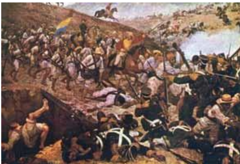
Batalla de Boyacá, óleo de Martín Tovar y Tovar, París 1990. Ilustración tomada de internet.

Entre 1818 y 1820 se presentaron situaciones internacionales que contribuyeron a acelerar la crisis del dominio colonial español.