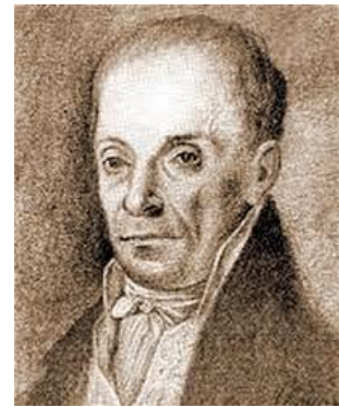
Juan Sánchez Ramírez 1762-1811. Tomado de internet.

Estos conflictos ocasionaron en 1808 la organización de la denominada Guerra de la Reconquista, dirigida en la parte oriental de la colonia por el líder hatero Juan Sánchez Ramírez y en el sur por el comerciante Ciriaco Ramírez. Con la ayuda del gobernador de Puerto Rico, Toribio Montes, los criollos lograron derrotar a las tropas francesas comandadas por el propio general Ferrand en la batalla de Palo Hincado lugar cercano al poblado de El Seibo, en noviembre de 1808.