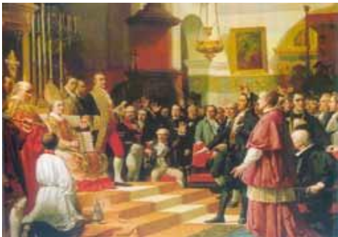
Juramento de las Cortes de Cádiz.