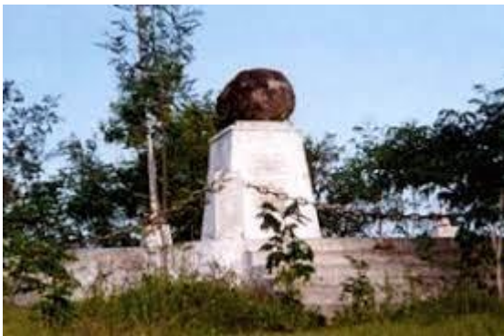
Monumento a la Batalla de Palo Hincado, cerca de El Seibo, foto tomada de internet.

Entre los criollos que se unieron para expulsar a los franceses, había dos posiciones políticas encontradas. Mientras Ciriaco Ramírez, Cristóbal Húber y Salvador Félix y su grupo planteaban la independencia política del territorio, el grupo encabezado por Juan Sánchez Ramírez era partidario de la reincorporación a España. Debido a la influencia económica y social de los hateros, éste último se impuso y en la denominada Junta de Bondillo, convocada a tales fines en diciembre de 1808, se reconoció la autoridad