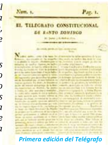
Primera edición del Telégrafo Constitucional

Santo Domingo va a ser un pueblo agricultor, y levantar el edificio de su felicidad, de su fuerza y grandeza sobre la agricultura, que por su superioridad sobre todos los ramos de historia natural es el objeto más digno de un pueblo liberal, el origen y fomento de la industria y del comercio, madre de la abundancia, principio de la propagación y multiplicación de los hombres, y manantial inagotable de la opulencia de los pueblos cultos”.