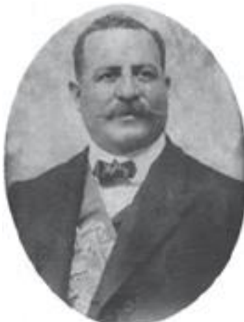
Ramón Cáceres (1866-1911).

En el ámbito financiero, Cáceres se mostró partidario de la re- negociación de la deuda externa, la ratificación del Modus vivendi y la obtención de un préstamo de 20 millones de dólares, gestionado en los Estados Unidos con una firma bancaria de Nueva York. Este préstamo fue hecho a través de la emisión de bonos a un interés del 5% anual y pagadero en 50 años. La deuda dominicana alcanzaba los $31, 800,510 en 1907.