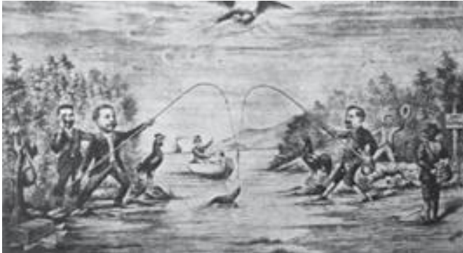
Caricatura sobre las luchas entre caudillistas.

El gobierno de Nouel respetó las libertades públicas, la Constitución y las