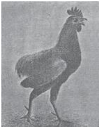
Gallo bolo símbolo del partido jimenista.

En ese momento, se organizaron dos partidos, el jimenista y el horacista. Ambos partidos eran similares en cuanto a estructura y manejo clientelista del quehacer político. El símbolo de cada uno era un gallo. En el partido de Jimenes, el gallo no tenía cola, era “bolo”, y en el Vásquez, el gallo tenía cola, era “coludo”. Cada gallo tenía una pata prieta y una blanca que representaba que cada partido estaba dividido en dos corrientes, una política y otra militar. Sus postulados sobre cómo desarrollar el país también eran similares. Sin embargo, la gran diferencia era que el partido de Jimenes estaba más cerca de los intereses económicos de los países europeos y el de Vásquez de los de los Estados Unidos.