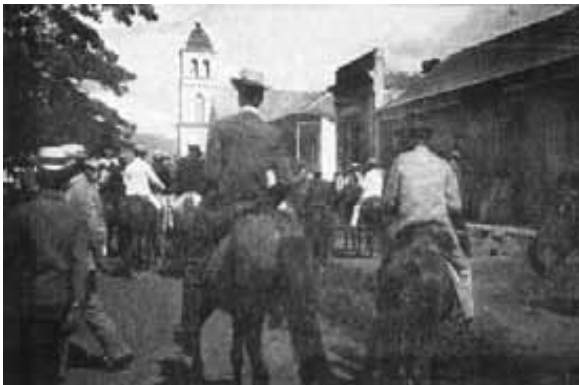
Llegada del Presidente Cáceres a la ciudad de Santiago.

Entre los objetivos de este gobierno se encontraban someter a los caudillos y controlar el territorio nacional. Para lograr estos propósitos desarrolló una política en dos direcciones que consistía en atraer a los caudillos regionales mediante “pactos” con nombramientos a cargos públicos, pero sin ningún poder real o la eliminación física de aquellos que no aceptaban su dominio. Para lograr este objetivo creó un ejército moderno centralizado.