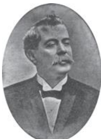
Juan Isidro Jiménez (1846- 1919).

Después del atentado de Moca, el gobierno quedó en manos de su vicepresidente Wenceslao Figuereo, quien intentó cohesionar sus fuerzas políticas y controlar la revuelta encabezada por los implicados en el tiranicidio. A mediados de agosto de 1899, Horacio Vásquez y Ramón Cáceres tomaron el control de San Francisco de Macorís y desde allí dominaron las más importantes ciudades de la región. En Santiago, Horacio Vásquez fue proclamado presidente del Gobierno Provisional, el 29 de agosto, mientras que Ramón Cáceres fue designado ministro de Guerra, iniciando las negociaciones con el gobierno de Wenceslao Figuereo, quien, ante la presencia de las tropas revolucionarias en las cercanías de la ciudad de Santo Domingo, renunció de la presidencia y dejó el Gobierno en manos del gabinete. El 4 de septiembre, Horacio Vásquez tomó la ciudad de Santo Domingo, aclamado como líder de la revolución.