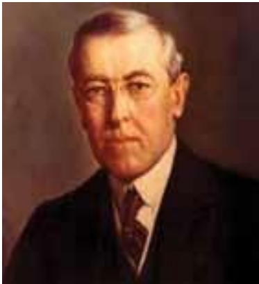
Thomas Woodrow Wilson (1856-1924).

¿Cuál era el papel del Gobierno estadounidense en la crisis política de ese momento? ¿Por qué se llamó Plan Wilson?