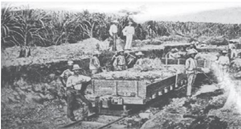
Obreros en el Ingenio Consuelo.

Como ya se había visto, desde finales del siglo XIX bajo la dictadura de Ulises Heureaux, los inversionistas estado-unidenses desplazaron a los europeos en el mercado dominicano. A inicios del siglo XX se apoderaron del control de la industria azucarera y establecieron los bancos Royal Bank of Canada, Nova Scotia