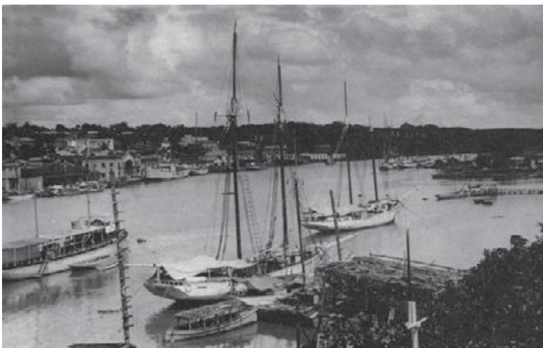
Muelle de Santo Domingo c. 1910.

al Gobierno dominicano de haber violado la prohibición de contraer nuevas deudas sin la autorización del presidente de los Estados Unidos, y exigió el establecimiento de un consejero financiero, así como el control de todos los ingresos y egresos del Gobierno dominicano. Además de la supresión del ejército y la guardia republicana, la creación de la policía comandada por oficiales estadounidenses, la reducción del presupuesto nacional y la revisión de todos los impuestos. La resistencia oficial a esta medida motivó un distanciamiento cada vez mayor entre el Gobierno estadounidense y el Gobierno dominicano.