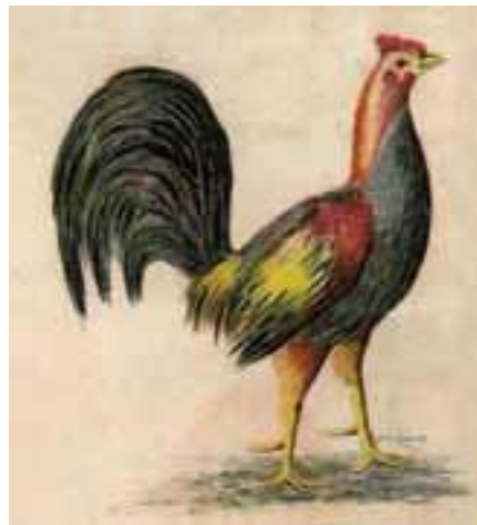
Gallo coludo símbolo del partido horacista.