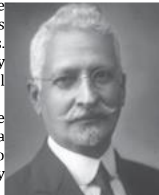
Federico Velázquez (1867-1934).

negó el nuevo presidente. Esto hizo que los Estados Unidos incentivaran nuevas revueltas con el propósito de lograr un gobierno que apoyara el Plan Wilson.