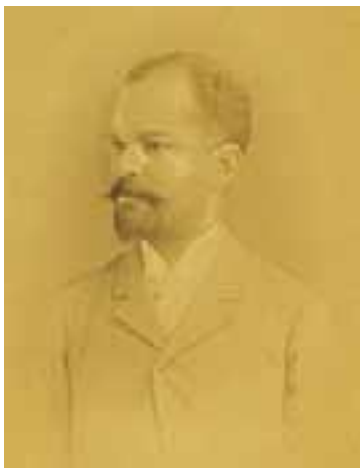
Alejandro Woss y Gil (1856-1932).

El nuevo Gobierno de los antiguos partidarios de Ulises Heureaux se caracterizó por el desorden en las finanzas y el peculado. Los empleados del Estado no recibían sus sueldos y los interventores de las aduanas distraían en su provecho las entradas fiscales. Además, desde el Gobierno se negociaba para ceder las bahías de Samaná y de Manzanillo a los Estados Unidos.