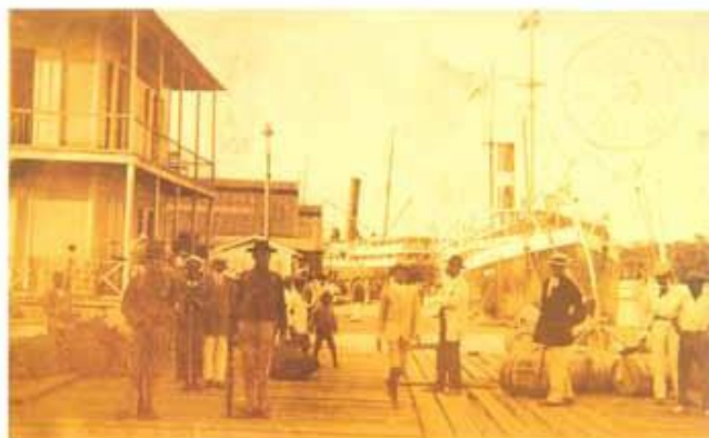
Soldados estadounidenses en el muelle de Santo Domingo.

“Una Convención fue concluida entre los Estados Unidos de América y la República Dominicana el día 8 de febrero de 1907, de la cual el artículo III dice: Hasta que la República Dominicana no haya pagado la totalidad de los bonos del empréstito, su deuda pública no podrá ser aumentada sino mediante un acuerdo previo entre el Gobierno dominicano y los Estados Unidos.