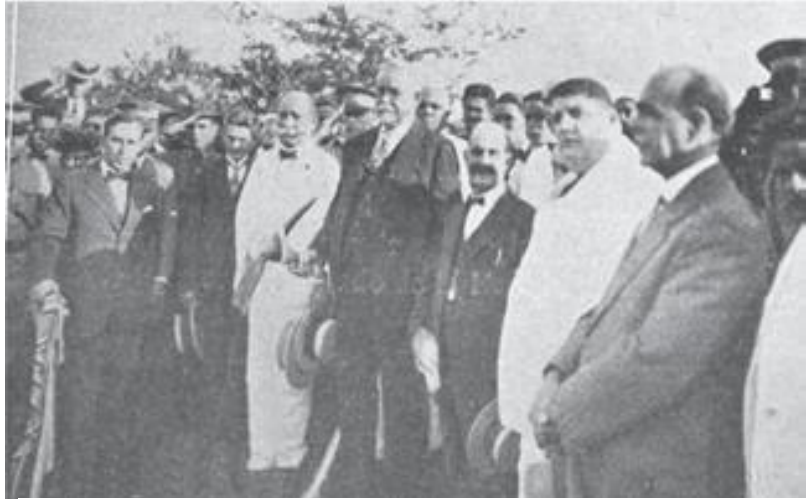
El presidente Horacio Vásquez en el primer picazo del acueducto de la ciudad de Santo Domingo, 1927.

Entre las obras públicas que se realizaron durante el último gobierno de Vásquez se encuentran la construcción de carreteras y canales de riego, sustitución de los puentes de madera por puentes de cemento armado, la construcción del acueducto de la ciudad de Santo Domingo y el inicio del alcantarillado de la