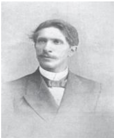
Francisco Henríquez y Carvajal