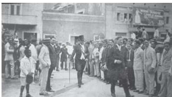
Presidente Horacio Vásquez caminando hacia la Catedral para un Te Deum.

El gobierno del general Horacio Vásquez firmó una nueva convención con los Estados Unidos llamada Convención Domínico-Americana de 1924. Fue aprobada en el Congreso e incluyó una emisión de bonos de 10 millones y el reconocimiento de una deuda de 10 millones del período de la Ocupación Militar.