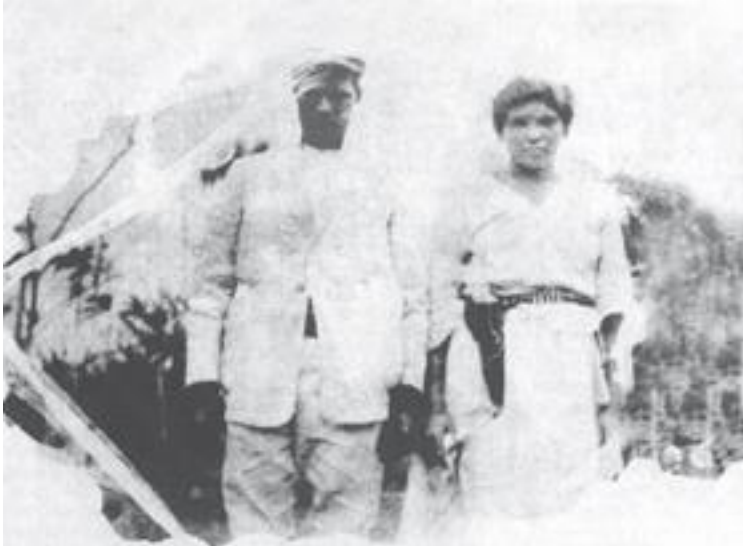
Fotografía de gavilleros Colección de Roberto Cassá.

Debido a la transformación en las formas tradicionales de vida del campesinado y el despojo de sus tierras, se produjo la reacción de grupos de campesinos que luchaban no solo para evitar perder sus propiedades, sino también contra un ejército extranjero. El precedente de esta resistencia armada fue el movimiento campesino de los gavilleros entre 1904 y