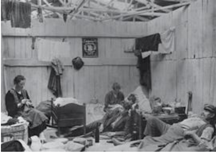
Una de las consecuencias de la crisis de 1929 fue el despido masivo de obreros y obreras.

La situación política se complicó cuando, en medio de la crisis económica mundial, el presidente Vásquez enfermó y viajó a los Estados Unidos, en octubre de 1929, para someterse a una cirugía renal. Regresó al país en enero de 1930, al momento en que todas las fuerzas políticas se preparaban para accionar, en caso de que este falleciera. Una parte de las fuerzas políticas de oposición entraron en contacto con el jefe del Ejército, quien se mantenía alejado del vicepresidente Alfonseca. El posible fallecimiento